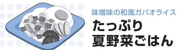
味噌味の和風ガバオライス たっぷり 夏野菜ごはん