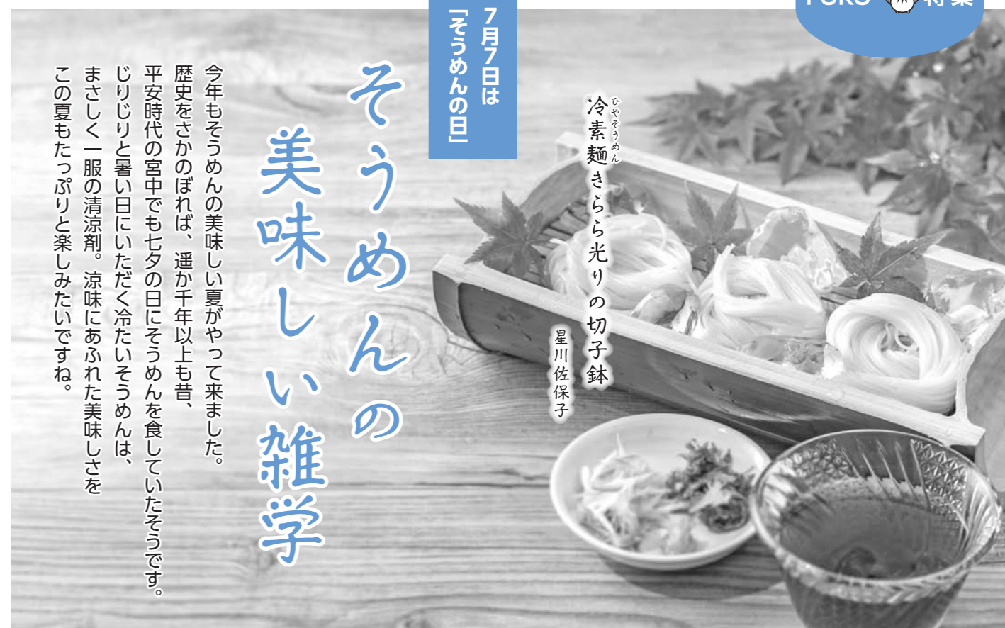
冷素麺さらさら光りの切り鉢 星川佐保子